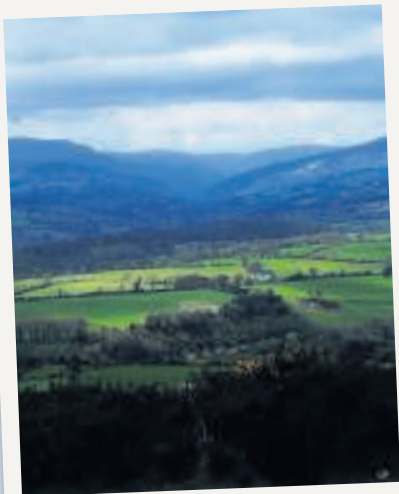
Wicklow: Dublins achtertuin.